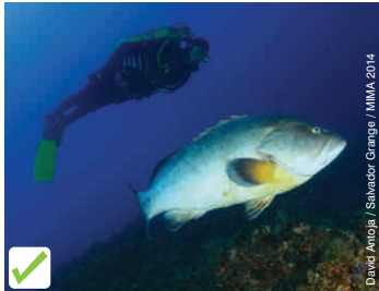
David Antoja / Salvador Grange / MIMA 2014

La diversitat de les poblacions de peixos és un dels principals valors del seu fons marí. Es pot fer una bona observació sense necessitat d'ofertir-los aliment.