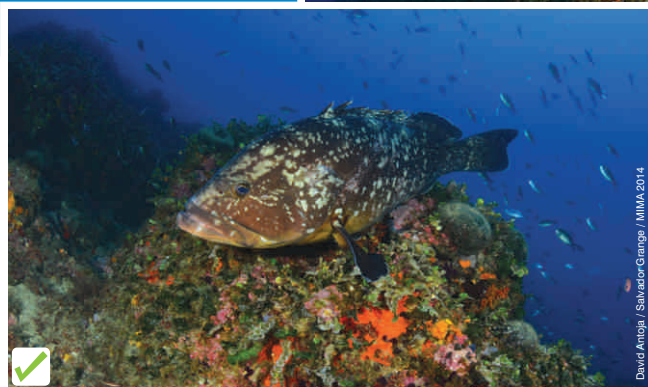
David Antoja / Salvador Grange / MIMA 2014

L'herbei de posidònia és un dels ecosistemes més rics del mediterrani i allà on neixen gran nombre d'espècies. Cal evitar ancorar-hi.